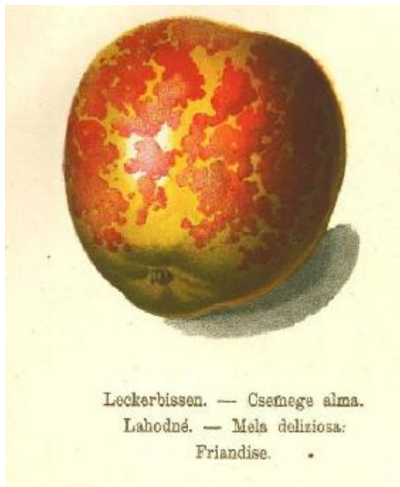
R.Stoll 1888 Pomologie.

ORIGINE : Hollande . Décrite pour la première fois par le hollandais Knoop , en 1760 . Multipliée dès 1867 dans les pépinières A.Leroy d'Angers et encore en 1916, plus en 1935. Conservée à Brogdale "The Book of Apples" 1993 , p.210.