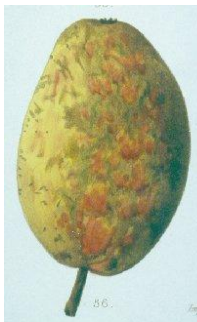
Mas, Le Verger, 1858, n°56.